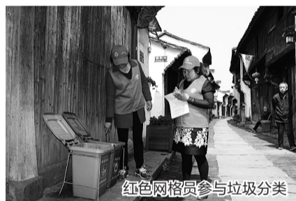
红色网格员参与垃圾分类

按照“四必到、四必访”的要求,在金华市金东区,有一群红色网格员,他们每周至少走访联系户一次,宣传平安知识和相关政策,了解掌握群众困难、矛盾纠纷等情况,并及时帮助协调解决问题,通过“平安浙江APP”上报。据悉,每天金东区