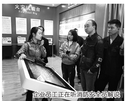
企业员工正在听消防安全员解说

“VR(虚拟现实技术)体验让我逼真地体验了一次火海逃生,紧张刺激之余也真切感受到掌握正确的逃生技能在遭遇火灾时是多么重要。以后我一定会重视企业消防安全,做好对灭火器、消防通道等的检查,确保消防通道畅通无阻,另外也要加强消防安全知识宣传,让每个员工都了解掌握消防