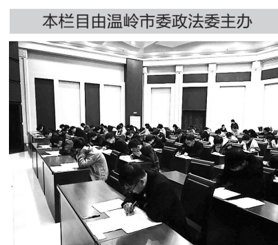
本栏目由温岭市委政法委主办

连日来,温岭法院执行辅警招聘如火如荼进行中。此次招录共吸引了89名考生报考,法院将通过笔试、体能测试及面试等方式对考生各方面素质进行全面考察,最终录取20名。图为笔试现场。