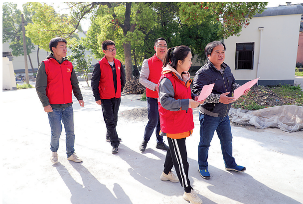
护鸟队宣传爱鸟知识

现如今,庙前漾周边的景观已按照马军山的设计焕然一新,但不管是亲水平台还是临水栈道,抑或是木质步桥和休闲场所,都保持在白鹭栖息地的安全距离以外,制造出“只可远观不可亵玩”的效果。而这片白鹭聚集区,也有了一个响亮的名字——“万鸟园”。人“鹭”为邻和谐相处,描绘出了一幅美丽乡村的幸福图景。