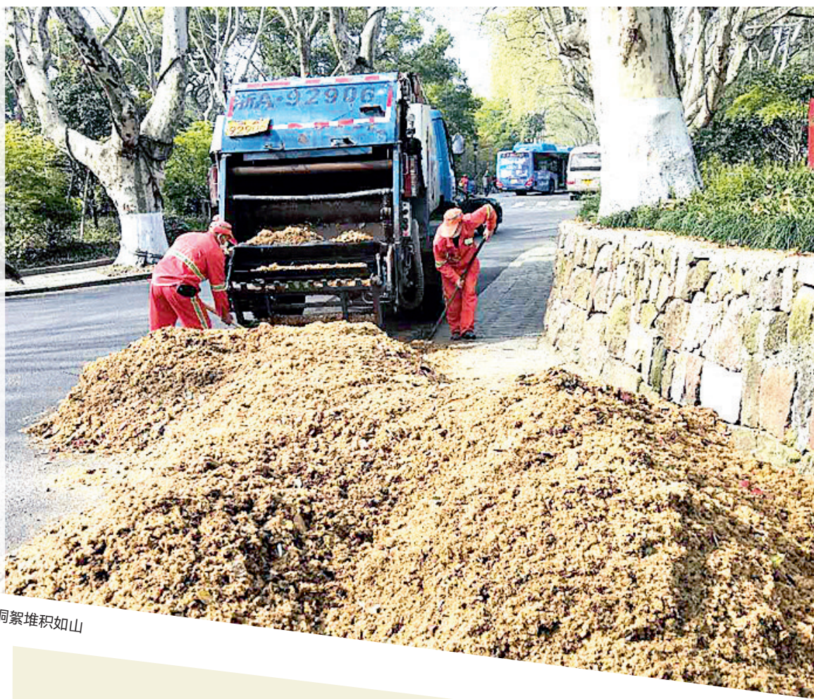
保洁员清理出的梧桐絮堆积如山