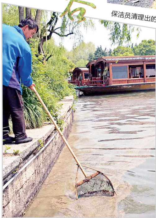
清理湖面上的梧桐絮