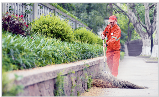
一阵风吹过,路面上就会积起一层梧桐絮