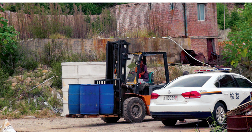
检察机关现场监督化工桶搬离