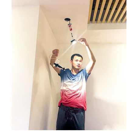
射灯里藏着摄像头

不仅如此,谢某某还将自己的“技术”做大做强,召集了一些“同道中人”组建起了工作室,形成了名副其实的“诈赌团伙”。