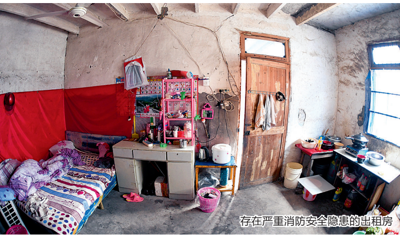
存在严重消防安全隐患的出租房