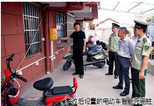
整改后设置的电动车智能充电桩