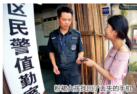
粉裙女孩找回了丢失的手机