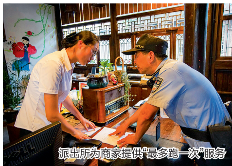
派出所为商家提供“最多跑一次”服务