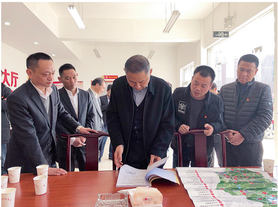
衢州市委副书记、政法委书记李锋调研紫港街道“最多访一次”工作