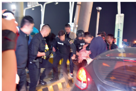
高速卡口抓捕现场