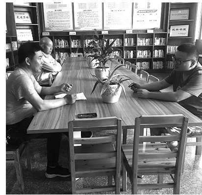
江南网商调委会在调解纠纷

“治”的同时,金华以“信义金华”建设为载体、以公民文明素质提升为重点,在全市范围内推进乡风文明建设,组织开展“好家风、好村风、好民风”活动、最美人物评选表彰活动,把优秀家训、最美故事编入村歌、乡土教材,纳入开蒙礼和家长会,推动文明乡风的传承,为基层稳定营造良好的农村社会风气。