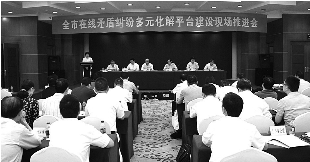
舟山市ODR平台建设现场推进会

为保证这个“指尖上的人民调解平台”能最大程度地发挥作用,定海区整合解纷资源、开展业务培训、加强跟踪督查,迅速在全区形成了共建共享平台的良好氛围。