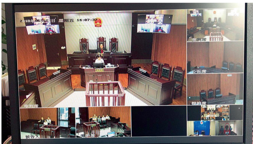
戚某因醉驾在看守所受审,她面前的直播镜头里不是球星,而是法官和检察官

喝着冰啤酒看世界杯直播,这是许多球迷的“标配”,但为了自身和他人的安全,“喝酒不开车”的铁律一定要谨记于心。早在世界杯开始之前,公安交警部门就再三表态将严查酒驾等违法行为,可就是有人心怀抱侥幸。