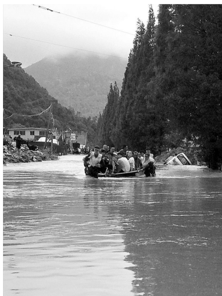
武警永嘉中队救援被困群众

本报记者 陈佳妮 陈立波 王志浩 蓝莹 实习生 王青 通讯员 谢章安 韦士钊 胡孙策 陈圆