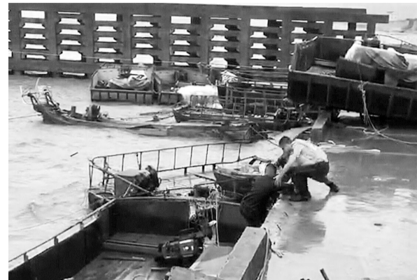
民警苦劝1个多小时,船老大终于上岸