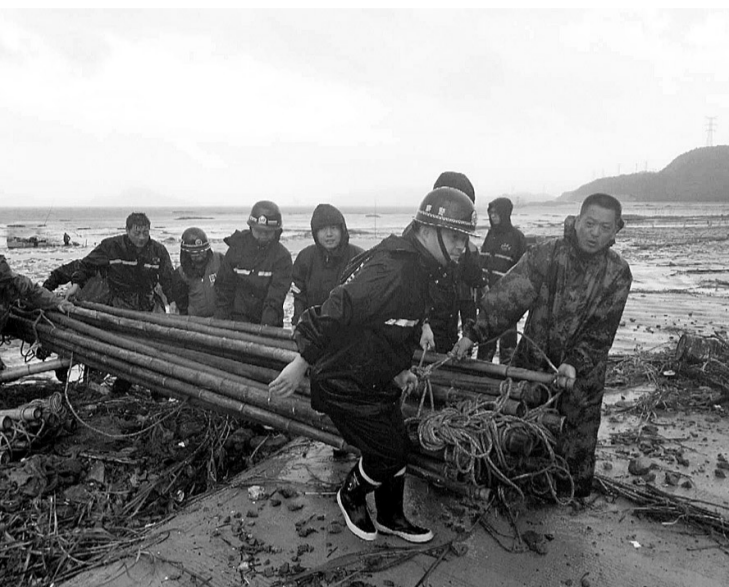
洞头霓屿派出所民警联合街道及村居干部帮助养殖户抢运毛竹

7月11日9时10分,台风“玛莉亚”(强台风级)在福建连江黄岐半岛登陆,登陆时中心附近最大风力14级。我省温州、台州、丽水等地也迎来大风大雨,公安、边防、消防、武警等部门全力抗台,保护群众生命财产安全。本报记者前往抗台一线,记录下那些“风雨无情人有情”的暖心故事。