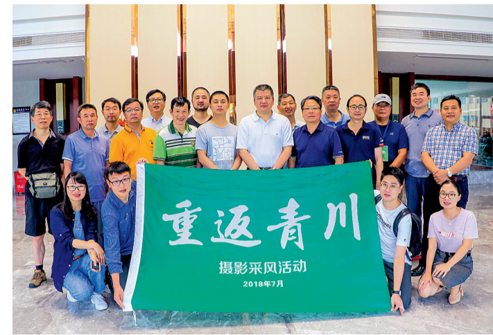
赴青川采风的浙江摄影师