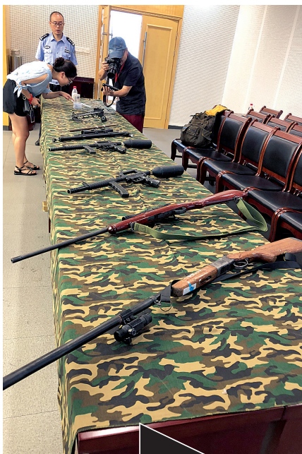
照片为警方展示缴获的部分非法买卖的枪支