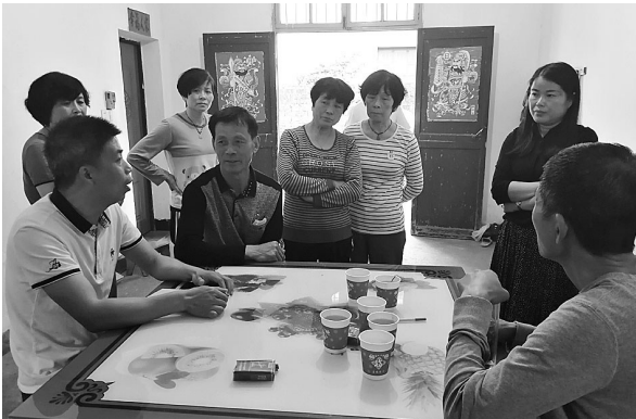
城中村改造过程中,干部走村入户做工作

衢江区廿里镇、上方镇等十多个乡镇,还通过开展“法律点亮生活”等主题行动,结合文化礼堂,以小品、唱快板、舞台剧等形式宣传法律法规,通过打造法治文化长廊、法治广场、法治之窗等特色展示区域,带动群众形成办事依法、遇事找法、解决问题用法、化解矛盾靠法的意识。