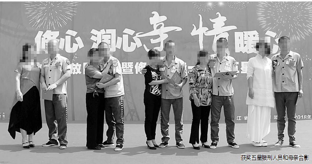
获奖五星服刑人员和母亲合影