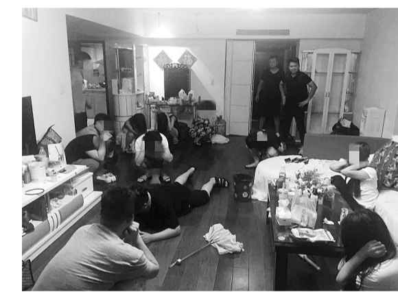
一张椅揪出卖淫嫖娼团伙