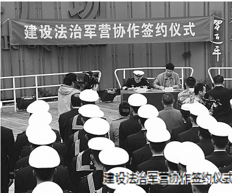
建设法治军营协作签约仪式。

深入实施宗教场所“十百千万”普法工程,组织全市宗教干部《宗教事务条例》大轮训,在普陀山开展“法治景区”创建工作,将法治精神融入到讲经布道中,助推形成依法信教的良好氛围。