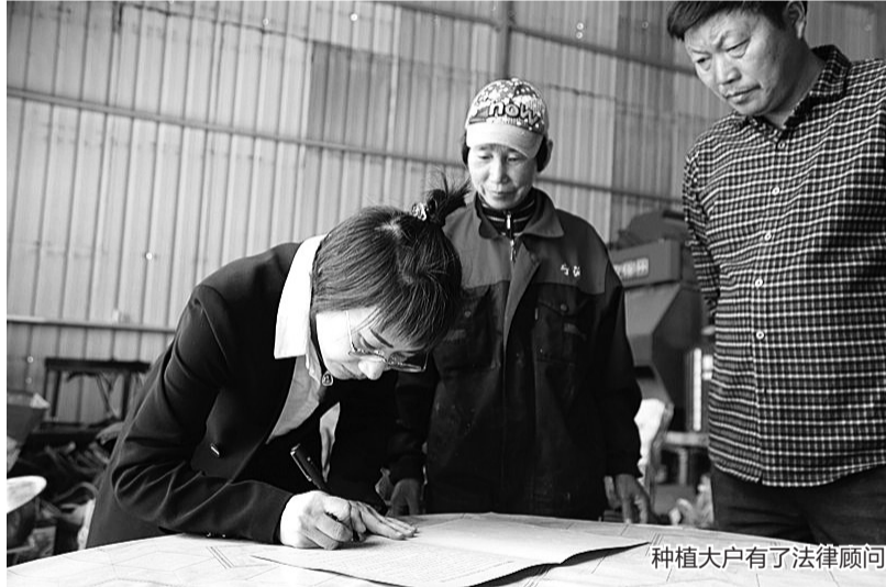
种植大户有了法律顾问

像梅花村这样的“乡村法律课堂”就是实施精准普法行动内容之一。据了解,该活动第一期在梅林街道河洪村等9个美丽乡村开展,以此来加大乡村普法力度,提升村民法治素养。据悉,该活动将在全县各村