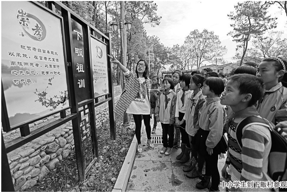
中小学生在下畈村参观