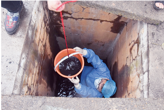
只能通过人工排水的方式