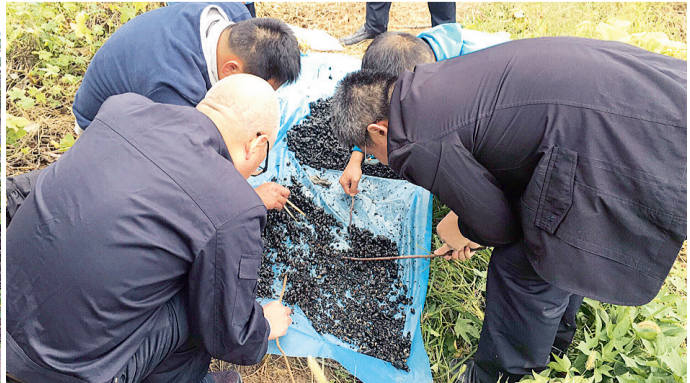
侦查人员从淤泥中寻找头发、牙齿、碎骨