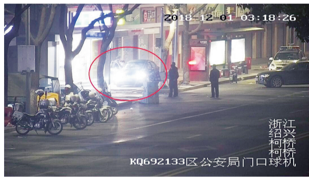
歹徒走出店门,准备上车逃离