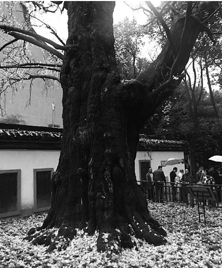
小蓬莱古树公园里的千年银杏