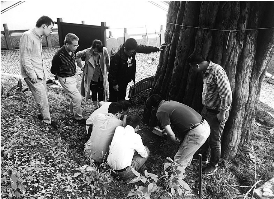
为榉溪红豆杉古树挖掉水泥地面、卵石铺装及填埋的黄泥土

行迅速，常常将老龄树作为它的盘中餐，如不及时防治，最终银杏叶会被它疯狂吃尽。在对被害枝叶进行减除烧毁，消灭树枝内的幼虫后，这位“老者”躲过一劫，重新焕发生机。