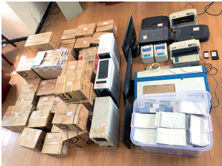
扣押的假发票与物品