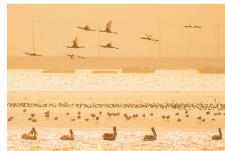
卷羽鹈鹕和其他鸟 摄于杭州湾 周佳俊