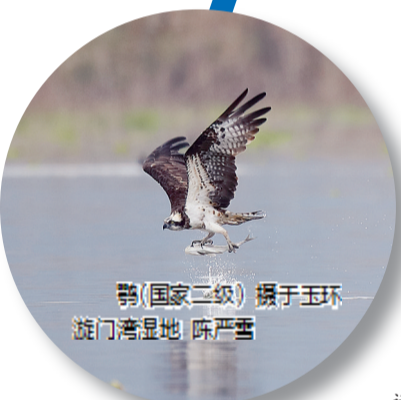
鸢(国家二级) 摄于玉环漩门湾湿地 陈严雪