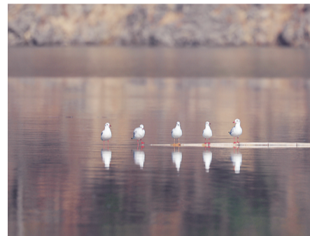
红嘴鸥 摄于安吉 温超然