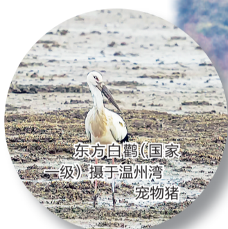
东方白鹳(国家一级) 摄于温州湾 宠物猪