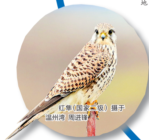
红隼(国家二级) 摄于温州湾 周进锋