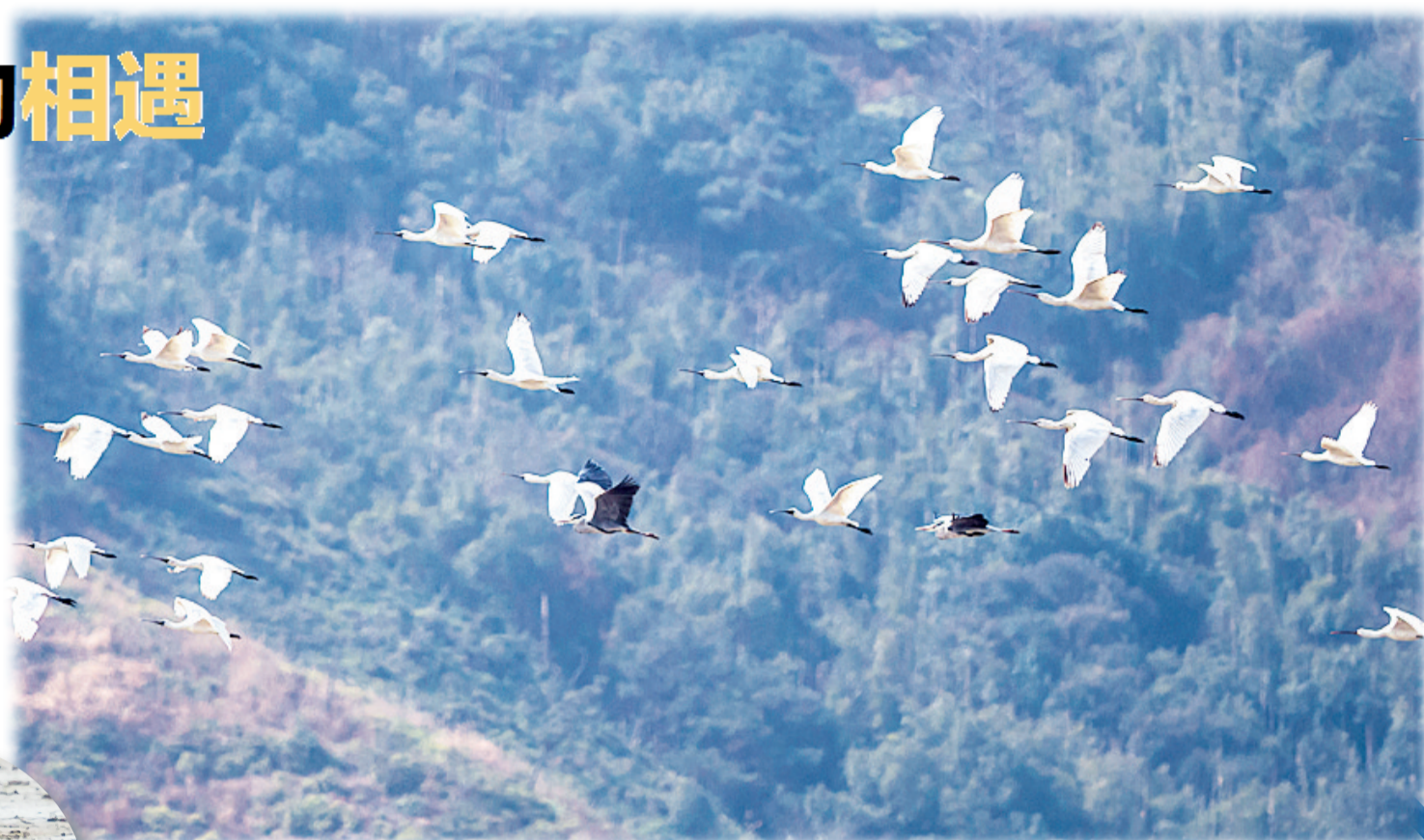
黑脸琵鹭白琵鹭(国家二级) 摄于玉环漩门湾湿地 周佳俊

每年冬季， 我与你有个约会。 你拖儿带女， 呼朋唤友， 奔袭千里。 我静待你来， 排设筵宴， 水陆毕陈。 你是天空的舞者， 你是水中的精灵。 我欢喜你， 追随你， 愿与你共盼春天。