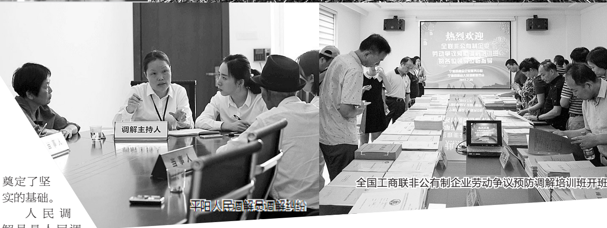
全国工商联非公有制企业劳动争议预防调解培训班开班