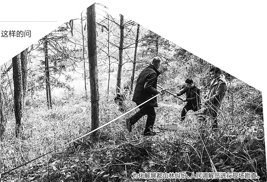
为化解屏都山林纠纷,人民调解员进行现场勘查。