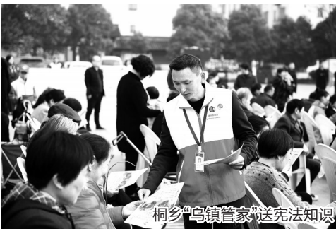
桐乡“乌镇管家”送宪法知识

社会治理是一项系统工程,需要发动全社会各方面的力量共同参与,尊重基层群众的首创精神,形成社会治理人人参与、人人尽责的良好局面。来自乡镇、街道的调委会、人民调解员积极开拓创新,为基层一线的和谐稳定,贡献了宝贵的“民间智慧”。