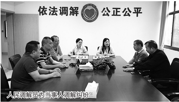
人民调解员为当事人调解纠纷

当前,信息化浪潮正以前所未有的速度席卷全球。我省各级司法行政机关紧跟信息化发展趋势,依托大数据、人工智能等手段,积极推动高新科技应用实战化、融合化,促进人民调解工作提质增效。