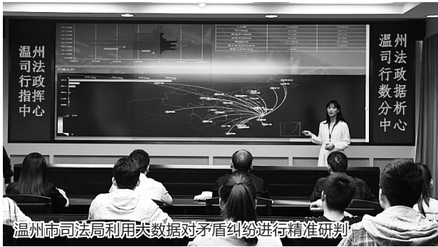
温州市司法局利用大数据对矛盾纠纷进行精准研判