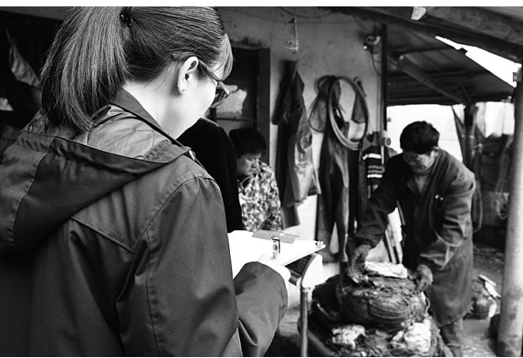
执行人员对甲鱼现场称重