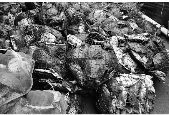
执行现场,甲鱼堆积如山