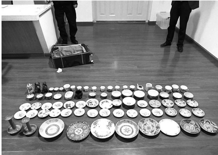
入库前清点核查涉案物品

据了解,为推进以审判为中心的刑事诉讼制度改革,舟山市公安局探索建立本岛刑事诉讼涉案财物跨部门统一管理模式,以政府购买服务的方式委托安邦护卫集中管理,并在岱山、嵊泗两个离岛县域因地制宜设立涉案财物管理中心,全面实现形式诉讼涉案财物“一体化”管理、“换押式”移交、“规范化”处置的新型管理和处置机制。目前,舟山共