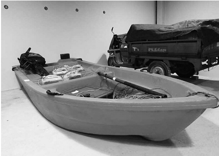
管理中心入库的涉案物品

统一保管、押运送件、远程展示、受托处置等系列专业服务及集中评估、鉴定等配合工作,进一步发挥集约管理的优势。由于舟山地理位置特殊,针对涉案大型船只、大批量集装箱、油品、冷藏物等统一存放管理的实际需求,目前由舟山安邦护卫有限公司出面,与符合保管条件的码头、冷库、易燃易爆物品及集装箱等单位陆续签订意向性合同,进一步健全超大宗物品保管场所名册,更好地服务基层办案。