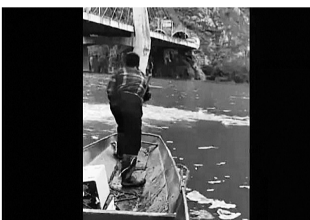
视频截图

鱼、网鱼等非法捕捞行为的通告》;11月17日石棉县农业局出台《石棉县三年禁渔恢复鱼类生态资源实施方案》等文件,后又通过河长制与各级河长陆续签订了《鱼类资源恢复承诺书》。