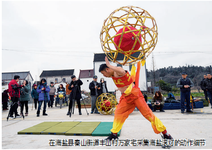
在海盐县泰山街道羊山村万家宅采集海盐滚灯的动作细节