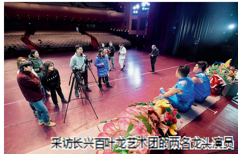
采访长兴百叶龙艺术团的两名龙头演员