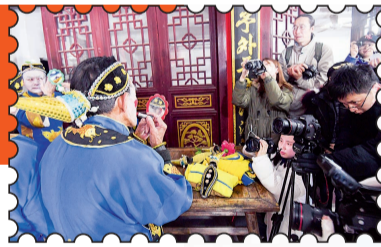
在温岭市石塘镇里善村拍摄大奏鼓表演队队员化妆

由中国舞协、中国文联舞蹈艺术中心推出的中国非遗传统舞蹈影像采集工程于2月14日至2月19日展开对浙江省国家级非遗传统舞蹈长兴百叶龙、海盐滚灯、温岭大奏鼓等舞蹈的考察工作。