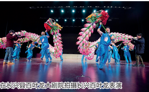
在长兴县百叶龙大剧院拍摄长兴百叶龙表演