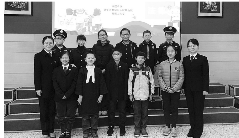
检察院做好未成年人检察工作

为维护公平正义,让公平正义“看得见”,婺城区检察机关不懈努力。组建“蔷薇工作室”未成年人检察团队,坚持惩戒并举,推进未成年