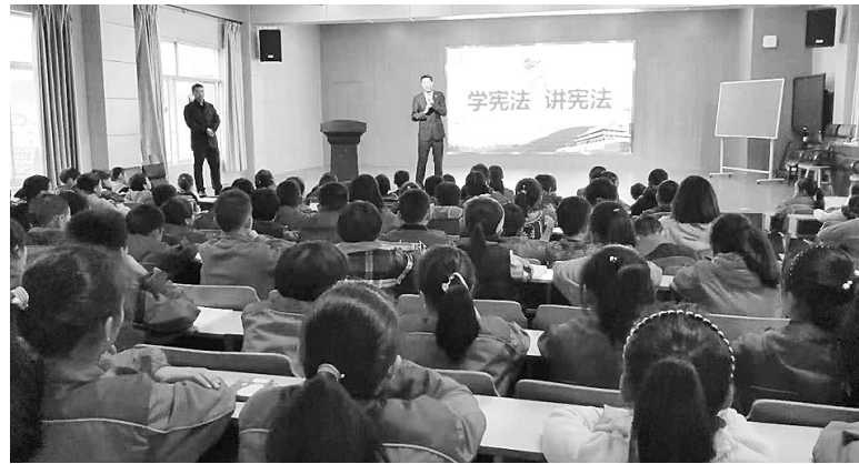
司法局组织法律宣传活动

为降低法律援助门槛,婺城区通过简化申请手续等方式,为农民工搭建起绿色援助通道,2018年受理农民工法律援助案件147件。据了解,全区现有人民调解员1591名,人民调解委员会468个,其中包含专业性调解组织20余个,2018年开展各类矛盾纠纷排查166次,共计调处民生纠纷796起。