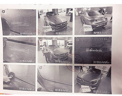
2016年车辆维修时的监控视频截图