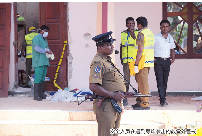
安全人员在遭到爆炸袭击的教堂外警戒