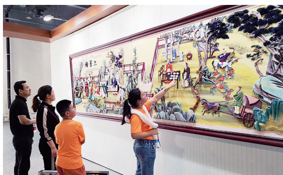
布糊画吸引许多参观者驻足