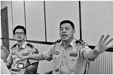
“党员老娘舅”交流个别教育心得

推出,越来越多的青年民警在“党员老娘舅”的帮带下顺利出师,有些还成为了监区管理工作的骨干力量。