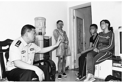
“党员老娘舅”深入服刑人员家中,调解服刑人员与家属之间的矛盾

服刑人员因生活琐事发生矛盾,该如何化解?刑期长,妻子提出离婚怎么办?身在狱中,如何处理财产纠纷……这些都是影响服刑人员改造最常见的问题,解决不好,不仅会对服刑人员的改造产生负面影响,甚至在他们回归社会后依旧会产生“后遗症”,影响社会和谐。为此,“党员老娘舅”从多方入手,及时帮助服刑人员解开