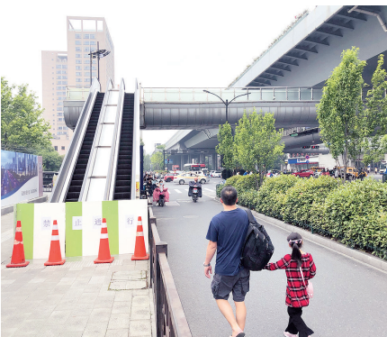
昨天一早,事发现场地面已恢复通行

邵俊表示,天桥的主桥和引桥都是整体生产后到现场拼装,钢箱梁属于钢筋混凝土结构。至于天桥何时复建,邵俊透露,要经安全检测评估并得到有关部门认可之后,再进行施工。