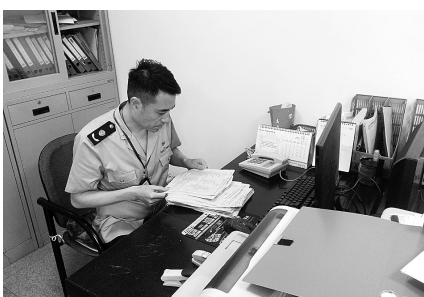
执法人员检查台账