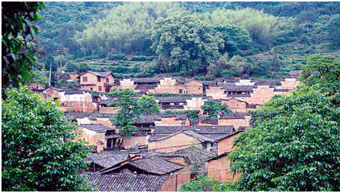
松阳县三都乡杨家堂村的清代民居群