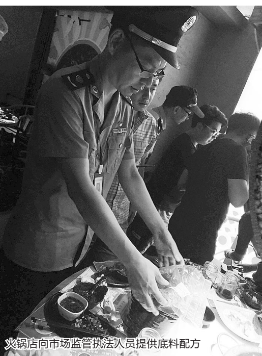
火锅店向市场监管执法人员提供底料配方