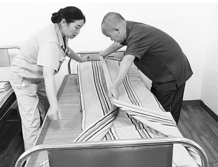
工作人员帮老刘一起叠被子

据统计,今年1至5月,杭州市救助管理站共救助流浪乞讨人员1786人次,帮助返乡1134人次。“对于流浪乞讨人员,救助站一方面为他们提供全天候的悉心照顾,一方面利用各种手段帮助他们找到回家的路。可以说,救助站是流浪乞讨人员‘临时的家’,也是他们的‘回家中转站’。”杭州市救助站业务科科长左伟说。