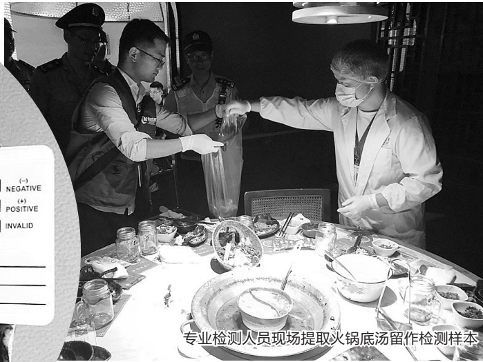
专业检测人员现场提取火锅底汤留作检测样本