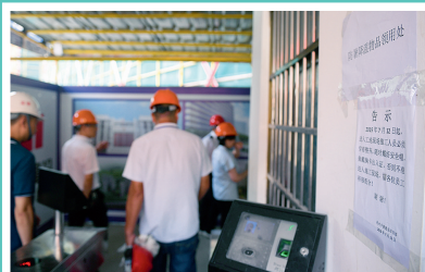
实名制通道入口处张贴了安全告示和防暑降温提醒