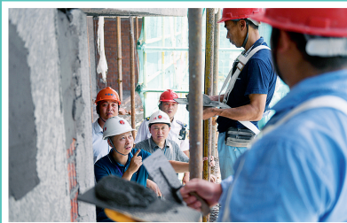
向工人介绍高空作业的注意事项

半天检查、走访结束,执法人员的脸上已挂满了豆大的汗珠,身上的制服也是湿了又干、干了又湿,他们除了在赶往下一个工地途中,能在车里享受片刻的清凉外,一直在用双脚丈量着每一个工地的角落,维护着工人们最基本的劳动权益。