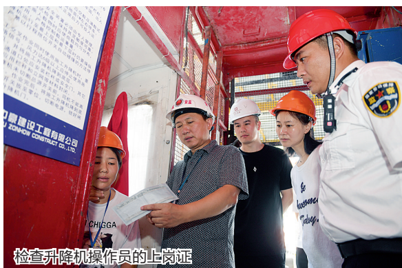
检查升降机操作员的上岗证