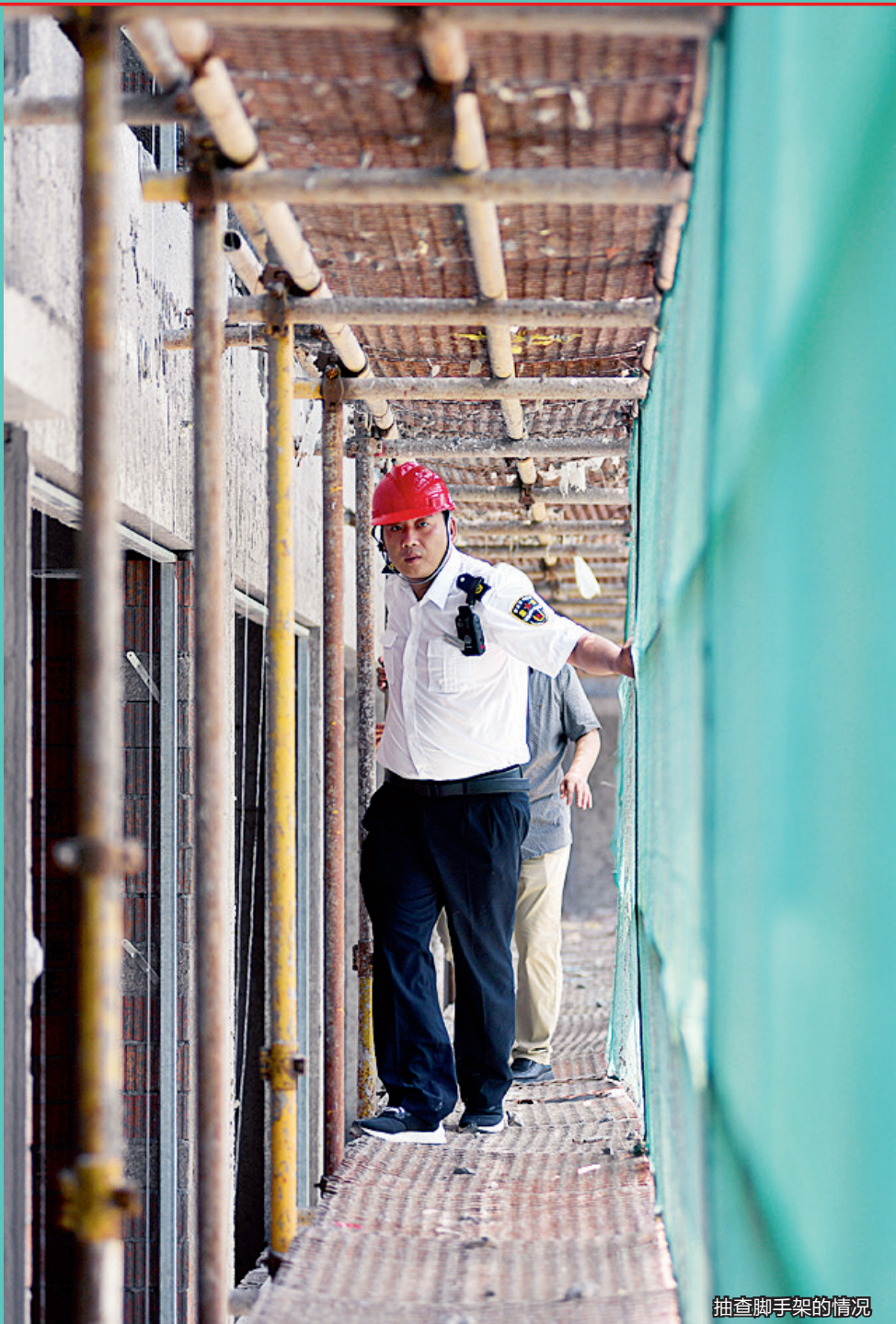
抽查脚手架的情况