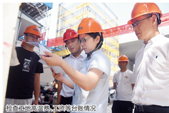
检查工地高温费、工资等台账情况