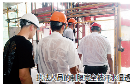
执法人员的制服完全被汗水浸透