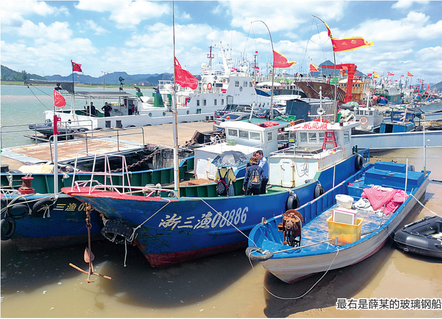
最右是薛某的玻璃钢船