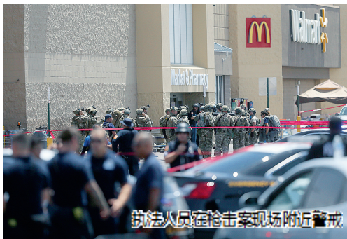
执法人员枪击案现场附近警戒