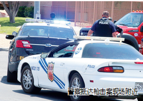
警察抵达枪击案现场附近

美国得克萨斯州西部埃尔帕索市3日发生一起严重枪击事件,警方证实目前已至少造成20人死亡、数十人受伤。得克萨斯州州长格雷格·阿博特在新闻发布会上说,这是得克萨斯州“历史上最致命的日子之一”。