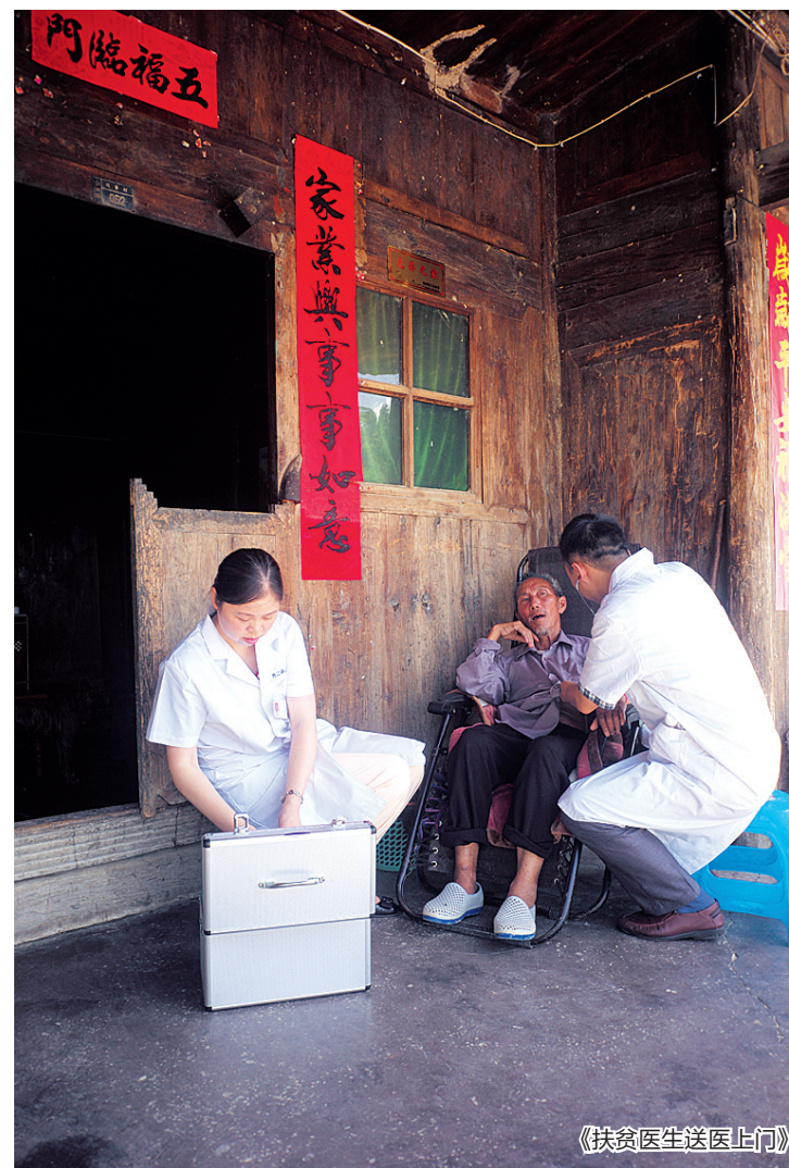
《扶贫医生送医上门》