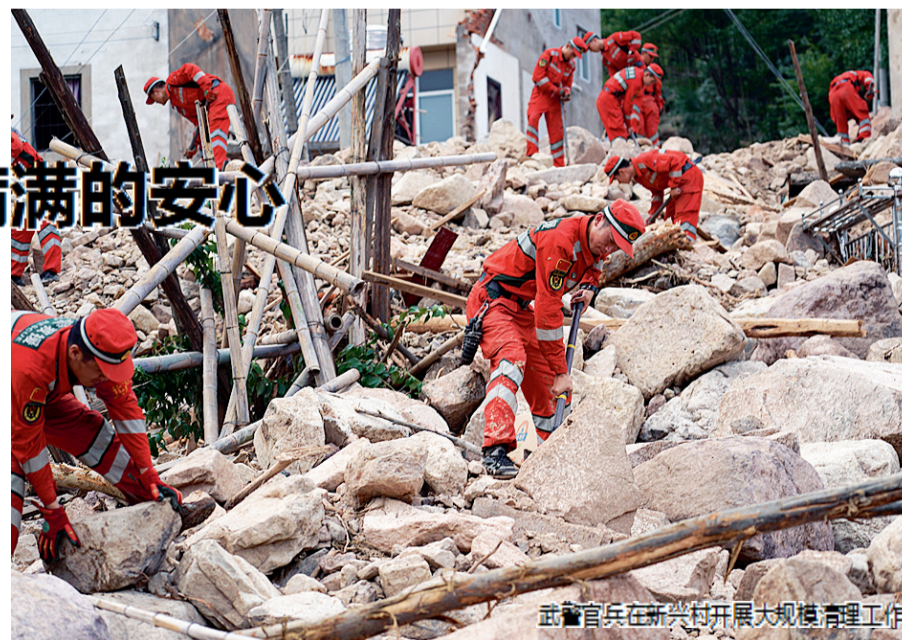
武警官兵在新兴村开展大规模清理工作

距离银坑村十几公里的新兴村,位于海拔656米的山坡上,整个村共有30几户人家,以老年人居多。和银坑村一样,突如其来的山洪打破了村子的宁静。窗户被洪