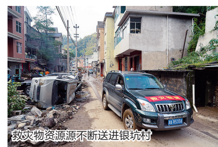
救灾物资源源不断送进银坑村