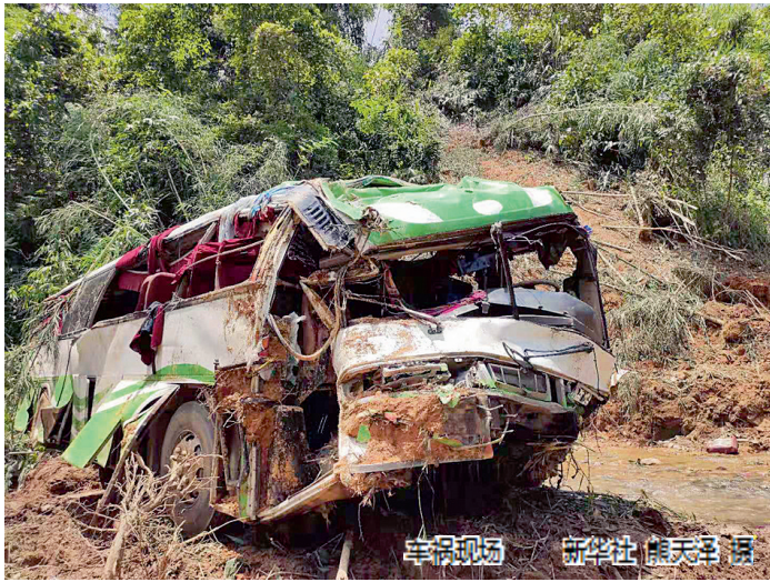
车祸现场

新华社 章建华 正在老挝参加中国—老挝军队“和平列车—2019”人道主义医学救援联合演训活动暨医疗服务活动的中国人民解放军赴老挝“和平列车”医疗队，20日携带急救药品和设备，前往琅勃拉邦参加对遭遇车祸同胞的救援行动。 据了解，“和平列车”医疗队当天派出两批各10人，紧急前往事故地点执行伤员救治任务。第一批人员由1名队长、6名军医和3名护士组成，包括根据此次车祸情况配备的紧急救援需要的心外科、心内科、呼吸重症、骨科、普外科和神经内科医生。他们乘坐我军直—8G改装救护直升机前往事发地点。第二批人员乘坐老方新舟60客机前往。 当地时间19日15时30分，一辆载有中国游客的旅游大巴在距老挝北部城市琅勃拉邦约40公里处发生严重交通事故。 接报后，根据中国驻老挝大使馆和驻琅勃拉邦总领事馆联合应急机制安排，中国驻琅勃拉邦总领事李志工率应急小组赶赴事发地点，协调老方军警和地方救援力量开展工作。 据来自救援现场的消息，大巴上共载有46人，包括44名中国公民和2名老方人员。截至发稿时，中国公民中有13人死亡，31人受伤，老方人员2人受伤，救援工作仍在紧张进行。