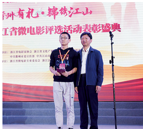
江山市委书记童炜鑫为获奖者颁奖

在第四届浙江省微电影评选活动表彰盛典上,评委主席王兴东携本届评审团成员亮相。王兴东表示:“微电影加上江山,孕育出了一个美好含义,那就是指点江山、描绘江山、锦绣江山和铸造江山。微电影虽然含‘微’,但并不说明它微小,一滴水也可以折射太阳的