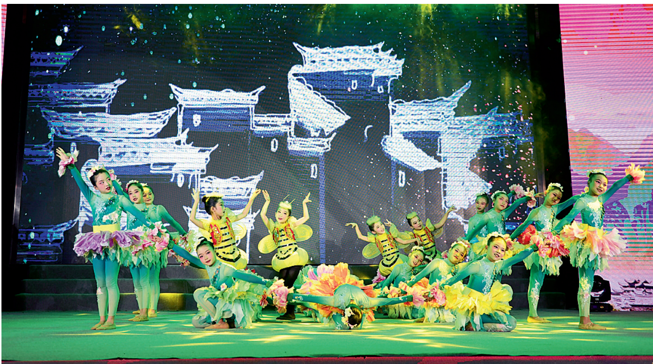
开场表演《花儿朵朵蜂飞舞》

光辉,一部微电影也能反映时代的印记,此次参赛的许多作品就用光影艺术反映时代脉动。此外,在本届微电影评选活动中,我们不仅看到了国内的优秀微电影,也看到了来自英国的精彩微电影,说明微电影已经成为世界性语言,成为碰撞思想、交流感情的一种纽带。”