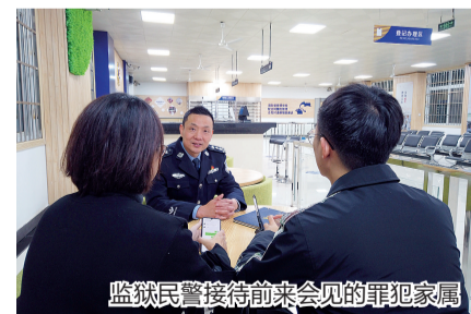
监狱民警接待前来会见的罪犯家属

让网友惊喜的是,浙江省司法厅副厅长、省监狱管理局局长徐华水也来到了直播现场。面对镜头,徐华水说:“从会见中心到会见服务中心,代表着浙江监狱把窗口服务当成联系群众、服务民生的第一