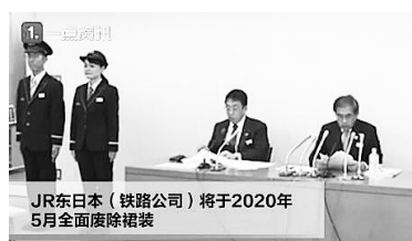
JR东日本(铁路公司)将于2020年5月全面废除裙装

JR东日本(铁路公司)近日宣布,将在2020年4月,首次引入女性裤装制服;从2020年5月开始,全面统一员工制服,废除女性裙装。日本航空联盟一项调查显示,1623名空乘人员中,有61.6%的受访者称曾被“偷拍”或“虽然无法确认,但认为遭到偷拍”。